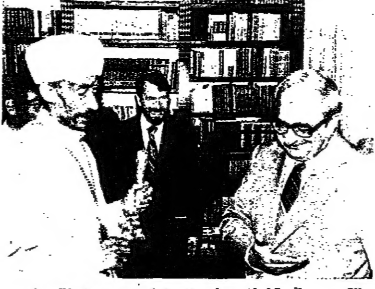
القدس - استقبل امس رئيس الدولة السيد بنسحاق ناغون في مقر رؤساء اسرائيل غبطة البطريك قنلا هيماوت رئيس الكنيست الارثوذكسية الاثيوبية . وقد تحدث البطريك هيماوت في هذا الاجتماع عن اوضاع الكنيسة الاثيوبية كما تناول الحديث موضوع مشكلة يهود اثيوبيا .

الايرانيين ، وتصريحات المسنولين في دمشق وبغداد ؟ ان السرعة التي اعلن فيها استنكاره لدخول القسوات الاسرائيلية بتغير تساؤلات كثيرة ، خاصة اذا قورنت بالتردد والتماطلاء والتحريف في التصريح الذي ادلى به بعد جريمة دار الحضانة في مساف عام . بقي شيء واحد نريد ان نقوله للايرانيين العام للامم المتحدة ، ومع اعتقادنا الجازم بأنه يعرفه تمام العرقه ، وهجر ان القسوات الاسرائيلية سوف تكون اول من يسحب من الاراضي اللبنانية . ويحترم سيادة لبنان ، اذا ساعد الدكتور فالدهايم السلطات اللبنانية على ان تكون لها سيادة حقيقية على الاراضي اللبنانية ، بحيث يتوقف لبنان عن ان يكون طريق العبور للذين يعلون على القتل والتدمير .